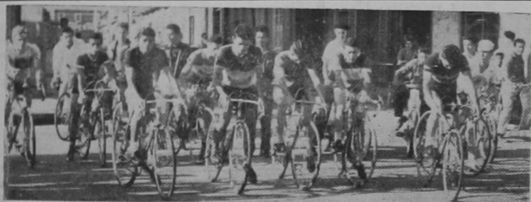
Será dura la competencia, pero agradable el triunfo.