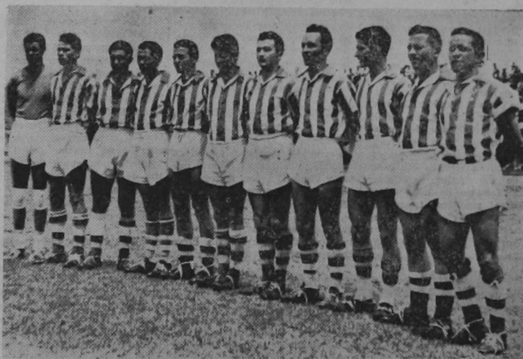
Los Brumosos será para ellos el honor de salir por la puerta grande...?