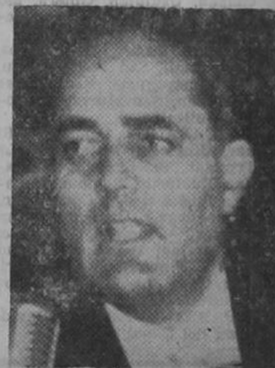
Presidente Echandi & Cía.