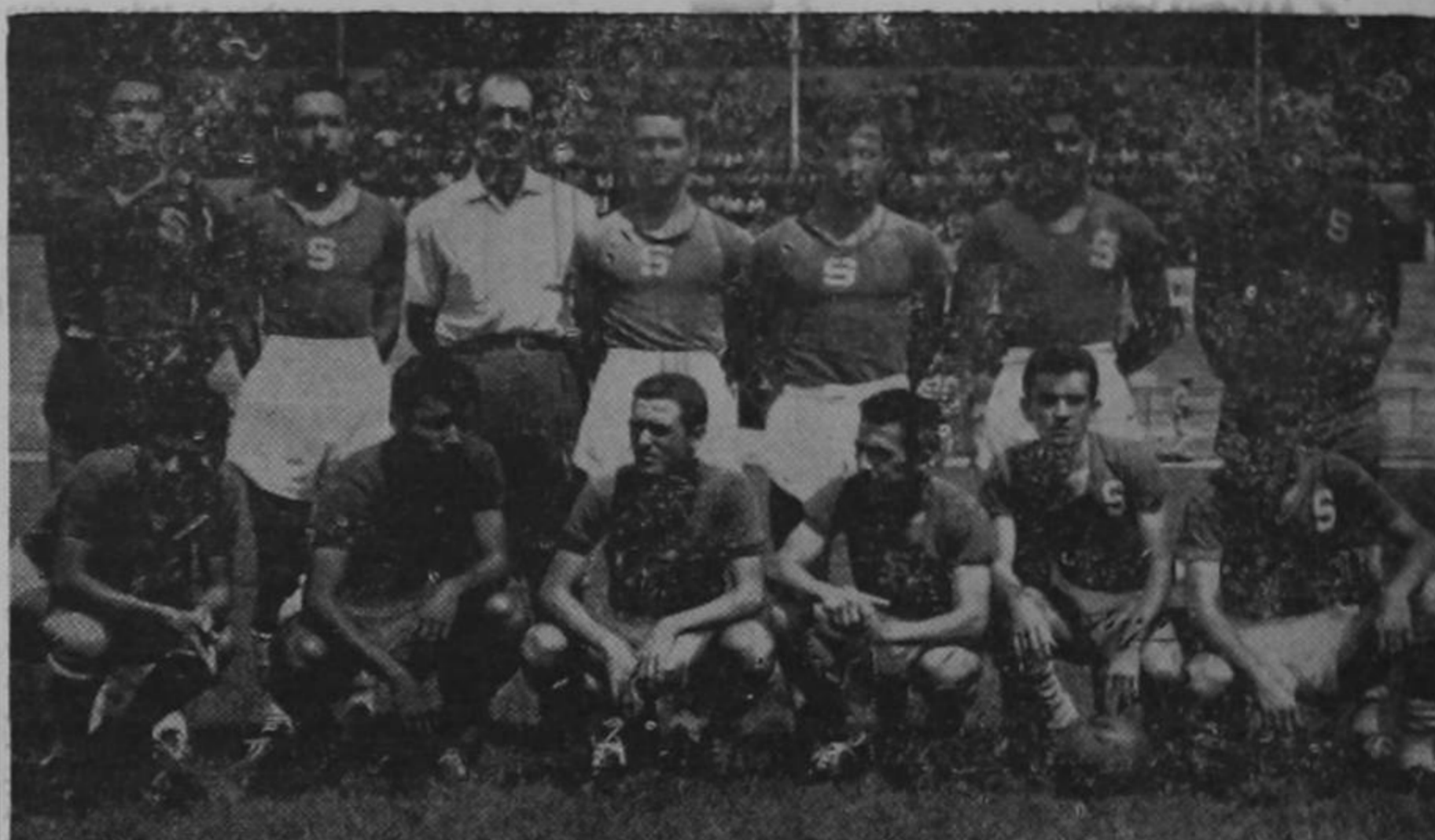
Deportivo Saprissa. Quedará eliminado, o saldrá por la puerta grande.

cantidad de jóvenes que han abandonado "otras actividades" para integrarse al mundo ciclista, lo que indudablemente redundará en su beneficio. Nuestro colega José Cornejo que estará presente mañana en la carrera, nos ha prometido una interesante crónica, que en nuestra próxima edición haremos pública.