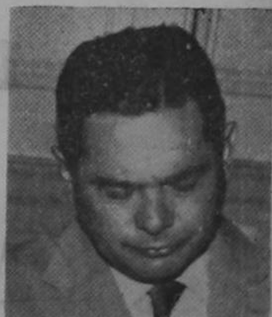
Ministro HERNANDEZ ...Arreglando maletas...

En las reuniones que ha tenido el Ministro de Hacienda, Ingeniero Alfredo Hernández, con diputados ha manifestado concretamente que son pocos los días que faltan de estar en el Gobierno. — Así lo dijo concretamente al diputado Roberto Losilla, agregando que sólo espera que las dificultades que se han presentado con motivo del proyecto de presupuesto para el año entrante queden solucionadas para irse a sus negocios particulares