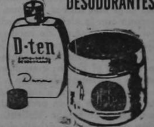
REGULA LA TRANSPIRACION DE LAS AXILAS Y LAS DESODORIZA POR VARIOS DIAS.

EMBARGO A LAS... Viene de la PRIMERA PAGINA