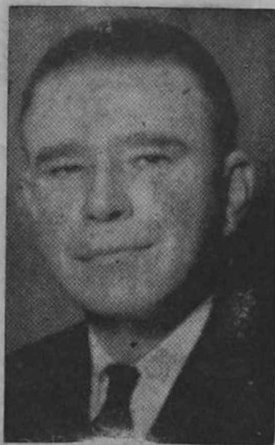
CANDIDATO ULATE... brindó con refrescos...